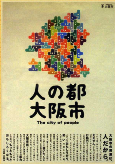
人の都大阪市のポスター

明治22年の市制発足から120余年になる大阪市政の中で注目を集めたポスターやチラシ等から、当時の大阪市政や市民の暮らしぶりを振り返りながら、当館収蔵の公文書や写真などで紹介します。