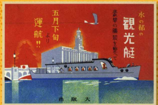
市営観光艇「水都」就航のポスター