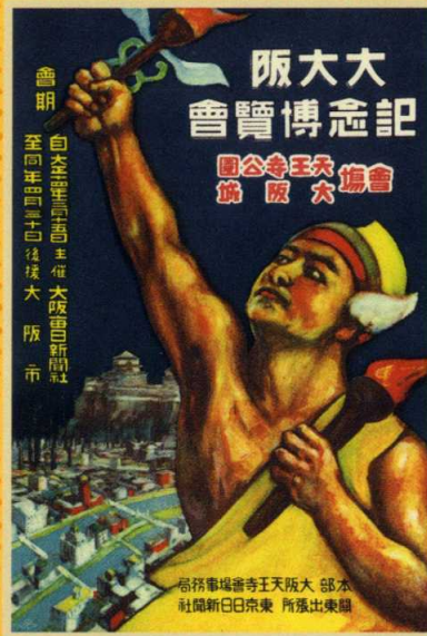
大大阪記念博覧会のポスター